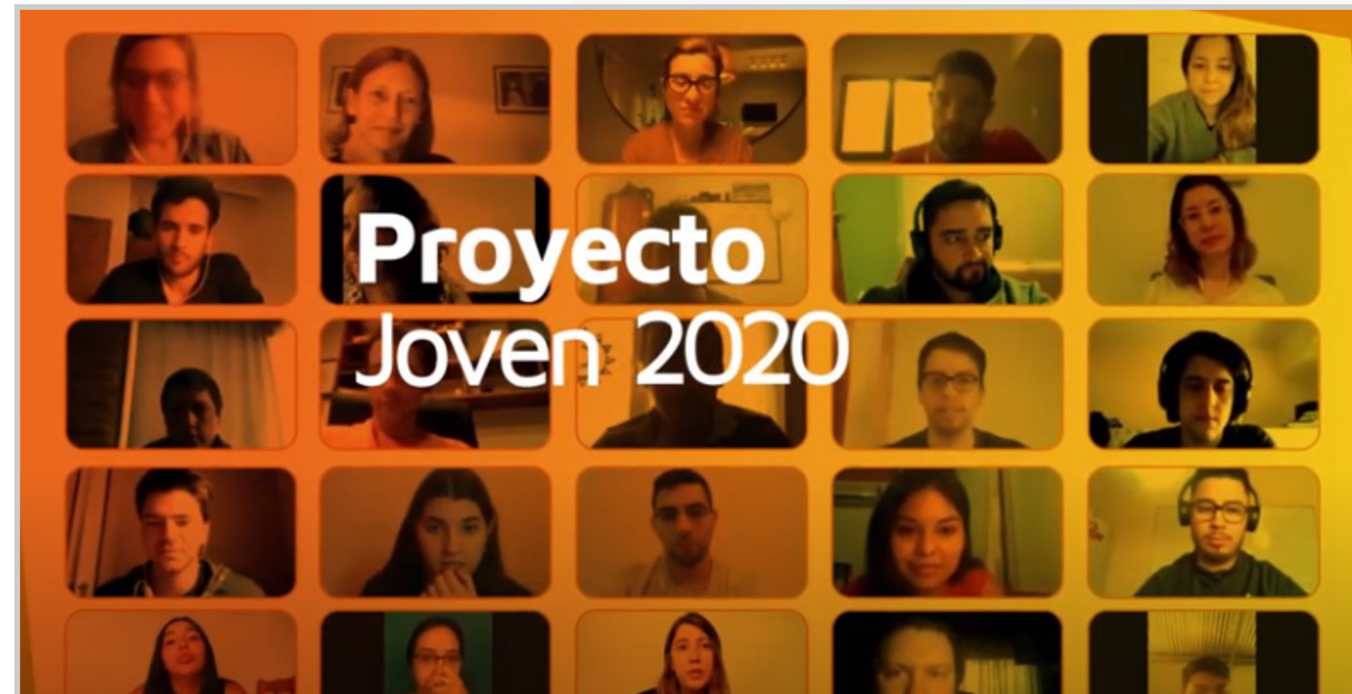
Proyecto Joven 2020. Resumen del primer año de programa