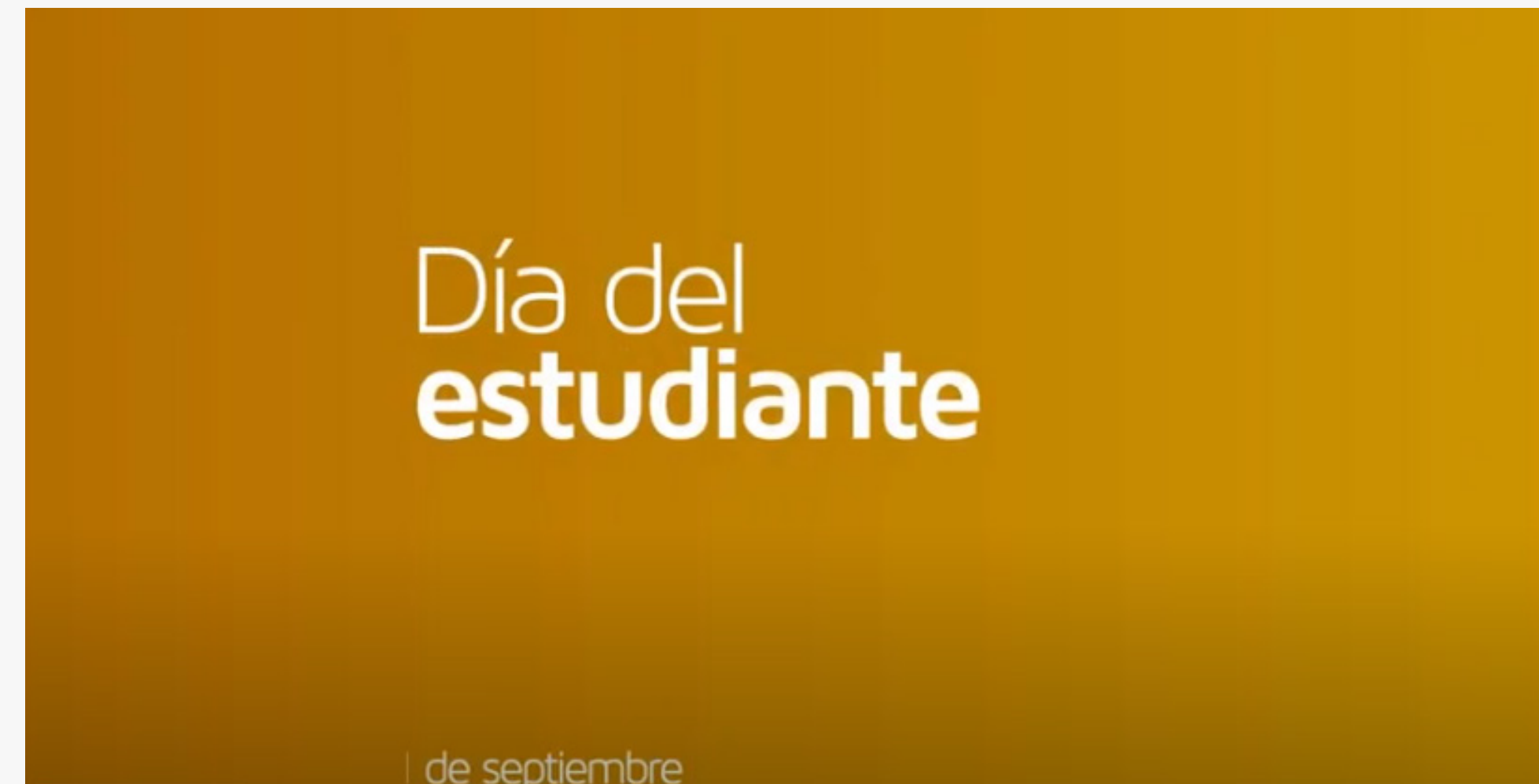
Día del estudiante